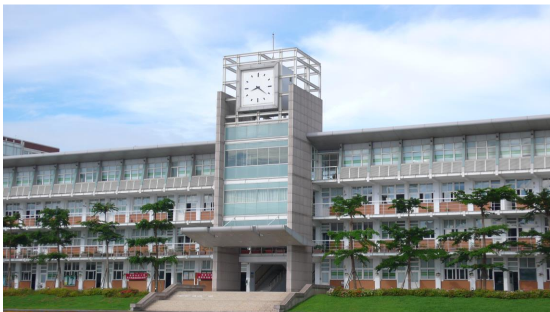
圖 3-5 嶺東科技大學春安校區